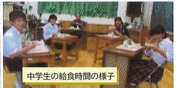
中学生の給食時間の様子

また、この県民週間に合わせていくつか学校行事も計画しています。ぜひ、ご近所の方をお誘いのうえ、金岳小・中学校で元気に楽しく学び合う口永良部島の子供たちやお孫さん、山海留学生の子供たちの姿を見に来てください。