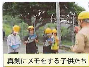
真剣にメモをする子供たち

小学生の子供たちは、口永良部島発電所の施設見学をしました。次々と出てくるたくさんの疑問「電線はどんなときに切れるの？」「ここで作られた電気はどうやって家庭に送られるの？」等について発電所勤務の