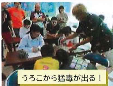
うろこから猛毒が出る！

5月から口永良部島に滞在し、魚の生態について研究している広島大学生4人が講座を開きました。子供たちは、性転換する魚が400種類以上もいることに驚いたり、魚が自分のなわばりに自分が食べるコケを育て、同じ場所に住んでいることを初めて知ったりするなど、広島大学生たちの講話を興味津々に聞きました。また、魚のうろこを触ると猛毒を出す習性を実際に観察したり、講座ごとに質問をたくさんしたりして、新たな学びの場となりました。