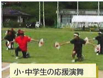
小・中学生の応援演舞

金岳小中学校・島民合同大運動会では、子供たちが島民の皆様と一緒に大綱引きや玉入れ等を楽しみ、元気に活躍しました。これまで授けられた休みの時間を主体的に練習してきた