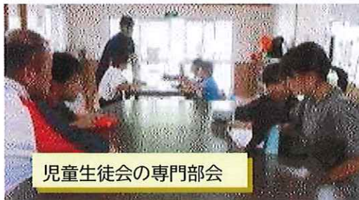
児童生徒会の専門部会

11月1日(水)から8日(水)まで地域が育む「かごしまの教育」県民週間です。島民の皆様もこの期間の朝9時30分から夕方15時までの時間帯は、皆様のご都合に合わせて自由に来校していただき、子供たちが授業で学ぶ様子、給食や休み時間を過ごす様子をご参観して下さいますようお願いいたします。